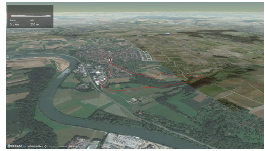
Themenweg in Stuttgart und Umgebung: Unterer Zipfelbach Video: Outdooractive, https://www.youtube.com/watch?v=aWART1xPji4