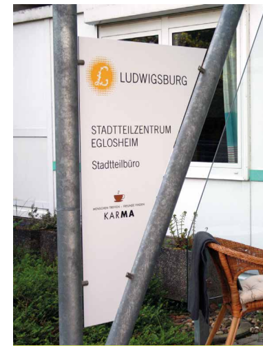
Eingang zum Café KarMa.

Vor der Unterführung biegen Sie links ab und gehen auf einem Weg zwischen Kleingärten und der Bahnlinie entlang. Diese Richtung behalten Sie bei und folgen dann der Eduard-Sprenger-Straße. An deren Ende biegen Sie links ab in die Straßenäcker. Von hier aus durchqueren Sie über den Montessoriweg das Studentendorf der Hochschulen Ludwigsburg. Am Ende des Weges biegen Sie links ab und gehen durch die